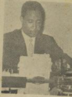
معالى حسن إبراهيم وزير الإرشاد والبناء