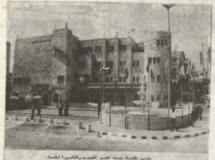
مبنى صحيفة صباحك بشارع القدس والقاهرة لعمارة

البلدية واما كنيسة المهد ولذلك كان من المفروض ان تنقل النافورة ليقع آخر يتناسب مع المهد اكثر مما يتناسب مع البلدية.. وهذا الامر ينتظم بالبلدية تنظيم ساحة المهد بفتح دخول ووقوف السيارات فيها (تأمين موقف آخر للسيارات). ثم ازالة المخبر بها لتوسيع الساحة وتسهيلها بالحجر وبعد ذلك يمكن تحديد مكان النافورة.. ولعل المكان الافضل في هذه الحالة هو مركز الساحة تماماً.. اسود ساحة كنيسة القديس بطرس ببروا واجدد مجلس الشيوخ اللذين صممها النحات والمعماري مايكل انجيلو.. كريم دساح