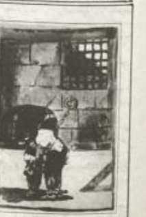
"البيضان" من اعمال غويلا

ولا شك في ان المؤتمر التشكيلي الاول سيكون حافزاً قوياً للفنانين بالصف والقطاع من اجل تعزيز وحدتهم واتحاد الاخوة المناهضة لزيادة دور الفن ورفع مستوى ونوعية مفاهمه، ان درجة اخلاص كل فنان يمكن ان تقاس من خلال اتجاذه ونسبته بوجدته الفنانين وصيغ نشاطه مع الاعيان المشترك للحركة التشكيلية.