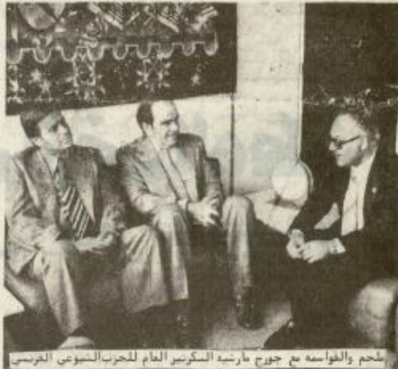
سليم والوفاسه مع جورج مارشيه السكرتير العام للحزب الشيوعي الفرنسي

تحدث في الموضوع ، وان عليه الاجابة على ادعاءات الدفاع . وردت المحاكمة فلسطينيا لآخر على مرافعة الادعاء بقولها ان الادعاء اعتمد على ما نشرته بعض