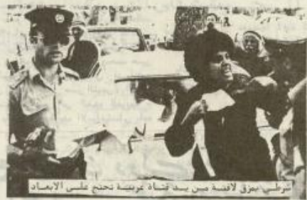
اسرائيلي يبرق لاقصة صين بيد تشابة عريضة تحتج على الابعاد

وفي بداية الجلسة ، التي استمرت ٦ ساعات متواصلة ، رد المدعي العام غريشيل باح على ادعاءات قديمي القضية ، وحاول باح في انشاء مرافعة القا "ثمة تجاوز للكانون على الطررف المتحوبة بالتوتر ، التي سادت الثقة في الثاني من ايار الماضي . وحاول بالبحو الى ما نشرته بعض اجيزة الاعلام - الادعاء بان المبعدين الثلاثة يعملون على "ايدة" دولة اسرائيل . الا ان القضاة لاحظوا في انشاء سير عمل الجلسة ان باح ٧