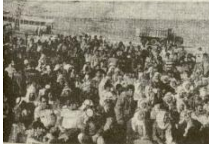
جماهير عرب النقب في مهرجان تميمي احتجاجا على تهديد

وسعى مشروع القانون على علاج لجنة الخارجية التابعة للكنيست توسيع رة الامارة دون الرجوع الى الكه ودون من قانون جديد لبقاء طالب ماير قطر عضو الكه والامن العام للحزب الكه الاسرائيلي في الجلسة بعدد القانون من جدول اجات الكه