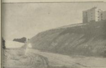
أشرف عمليات بن الشارع المحم الذي وصل الضفة الغربية مارا بمسوطنة عتاتوت . قرب عتاتوت . مستوطنة عتاتوت وادوميم على الضفة . وقد وصلت إلى الطريق الرئيسي بين القدس ورام الله . ويذكر أن طريقاً آخر سبق حالياً ليعمل مستوطنات التي يعقوب والسوسونة الطام في جرباً بهذا الطريق . وفي الصورة مدو النفا . أعمال بن الشارع شارع القدس - رام الله الرئيسي قرب الضفة الغربية .

١٩٤٠ على الإسكندرية . عما جدر الإشارة اليه أن لجنة الاستيطان قد خططت عام ١٩٤٠ عين الخطة . ولما كان مستوطنة جديدة في أراضي الضفة الغربية . ما يعني رفع عدد المستوطنات القائمة في الضفة الغربية إلى ١٥ مستوطنة . وسمى قرار لجنة الاستيطان بثلاث مستوطنات بالقرب من مدينة أريحا . ومستوطنة في غرب مدينة يافا وأخرى بالقرب من مدينة يافا . ويشير برلمان للتعاون المحلي بان هذا القرار . يأتي بعد إقرار خطة الاستيطان الخمسية التي وضعت في عام ١٩٤٠ إلى ١٥ مستوطنة .