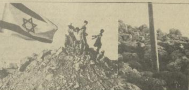
انسارات على موانع الأرض في الوحدة .....

لأغراض الاستيطان هي من الأراضي غير المستقلة وأن يطبقها من "أراضي الدولة"، ولكن يبدو أن الذي في تنفيذ خطط الاستيطان في قسم الجليل في الضفة، الذي بدأه أرشل تارون عندما كان وزيراً للحربية، والأفدباء بالثاني من مناطق النجعات السكانية العربية بعد منازعة هو الذي أعلن إدخال سيطرة رسمية على أجزاء من مصادر الأراضي وأصدر بعض بياضين "تخديد المزروعات" مع ملاحظة أن تنفيذ هذا القانون قد ابتدا قبل فترة طويلة من صفوره.