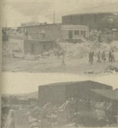
عقد من المعابر الغربية في "بيت فجار"

بعدلها بعد الاجراءات الإسرائيلية الأخيرة أقل من حد الجوع، ويضيف الحال بأن ربع مجموع سباعهم في تقرير الدولة مع أصحاب العمل في وجه الإحتلال التي يعمدون لها جميعا بسبب يخطط لاما الحاجر الإشتياقية، كما أن ذلك يمنع من تربية مولا، العمل التي يورث العمل الإسرائيلية لكتب رؤاهم الضرورية