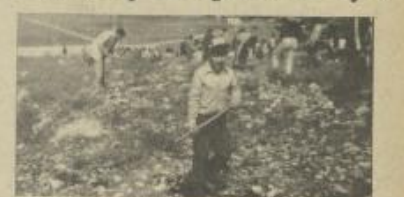
أول المخطوطين نسوب الأرض منسوبة موسم الفصول

وقعت لجان العمل التطوعي في الضفة والقطاع أعمالاً في حالة طوارئ، بناء على قرار اللجنة العليا في الإسراع العامي استعداداً ل موسم الزراعة الحالي، فزراعة آلات الدورات بأشكال الزبون والخصائص.