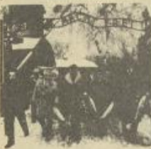
الناجون بحيون الذكرى الاربعين لتحرير الجيش الاحمر للمعسكر

أعلن ممثلو رابطة الحقوق في بنغازي أنهم سواحقون مقاطعة جلسات المحاكم حتى تحقق مطالبهم التي تتمثل في الماء الاحكام العرفية لوزر وتشكيل حكومة انتقالية محايدة لاجراء انتخابات برلمانية واستعادة الحقوق والحريات المدنية.