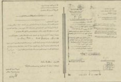
الجدير بالذكر الموعود الذي حددته السلطات لإخلاء البيوت هو الخامس من آذار القادم.

لا يدل على استمرار الحركة التطارية الواعية بالعمل على تنظيف الباحة النيابية من الطليقات الملقاة بها أو التي تلقاها الرحمة النيهان بواقعة ولا يدل على تعرية أولئك المزيين الذين يدعون زوراً أنهم يمثلون العمال فيصممون إلى سدة القيادة تحت شعارات زينة جاذبة لتكتشف حناجر العمال رفهم بعد قليل. تلك مهمة صعبة، إذا ما أريد بلورة طبقة عابرة لحدودها على غاتها السلوكيات التاريخية الجسيمة بالنسبة لثقافتها ووطنها أيضاً، ذلك أن العهد تمثل قبل كل شيء بلورة وهي عتالي وطني يكون في مقدوره حماية المسيرة ورد المتاربع الضمومة وفتح الضباب والانتهازية والتعب بمصالح العمال والتأمر عليها، فالوعي قبل كل شيء، والنجاح في تعرية أولئك المزيين بالكثف من حقيقتهم وعن غطرسة ملكهم على مصالح العمال يمثل انتصاراً لذلك الوعي ووعداً آملاً بالمستقبل الطائر للطبقة العاملة.