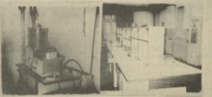
مختبر "الوطني" : رفوف شبه فارغة . جهاز الكلية الاصطناعية