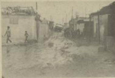
السلطات تستنكر على أهالي بيت لاهيا حتى الاكتفاء والحوال

هذا وما يوضح أبعاد أضرار السلطات على أهلاً بيت لاهيا، الدائرة التي تشرف على العملية وهي "فرع ناهل اللاجئين" التابع للإدارة المدنية في غزة، وكما هو معروف فإن هدف إقامة الدائرة المذكورة هو تنفيذ مشروع توطين اللاجئين بس، الميت.