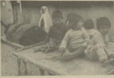
لبن يفرس هؤلاء الأطفال لاعتدائهم