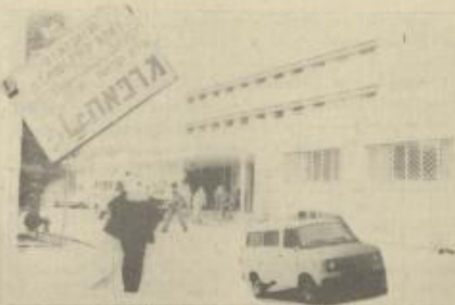
مدخل مستشفى رفديسا / نابلس

الضفة الغربية - كما ستكون في المستشفى في وضع خرج للامية اذا ما تمثل الصدمة الوحيد الذي يعمل - قلبي لدينا بعد احتياطي ان استمرار هذا التضييق في الاجهزة والمعدات واللوازم الطبية في مستشفى رفديسا سيؤدي في حال استمراره الى هبوط حاد وخطير في مستوى الخدمات العلاجية المقدمة للمواطنين -