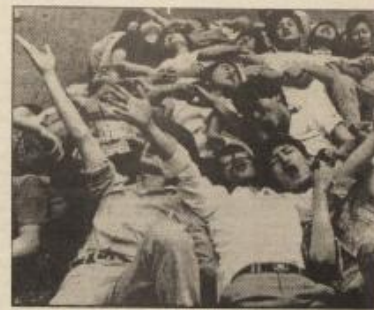
طلاب جامعة "يونسى" في سيئول يعطون حركة السير في شوارع العاصمة الكورية مطالبين بوحدة الشعب الكوري.

ان وحدة كوريا هو الموضوع الهام الذي يشغل بال الكوريين هذه الأيام وقد لاحظت مجلة "تايم"، كم هو حساس هذا الموضوع بالنسبة للكوريين. وكنت أرى توحيد الكوريين من من الكليات غير الحرم في كوريا الجنوبية. فقد تقسيم البلاد عام ١٩٤٨ كان كل رئيس يقع في أوليها "توحيد" شطري كوريا. واشتت "وزارة التوحيد" في كل حكومات كوريا الجنوبية منذ عام ١٩٦٩. لكن وحدة الكوريين تعتبرها عقبة حدة، أهمها التدخل الأمريكي