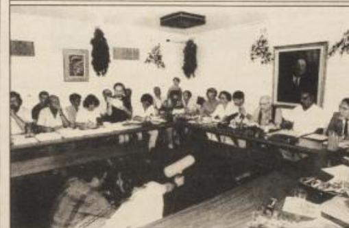
• جانب من المؤتمر الصحفي الذي شارك فيه الكتاب والفلسطينيون والاسرائيليون

وقد دعا الاتفاق حكومة اسرائيل الى فتح باب المباحثات فوراً ، مع منظمة التحرير الفلسطينية بهدف تنفيذ اتفاق السلام المقترح . ويخضع الاتفاق بتأييد اكثر من ١٥٠ كتابا اسرائيليا وفلسطينيا