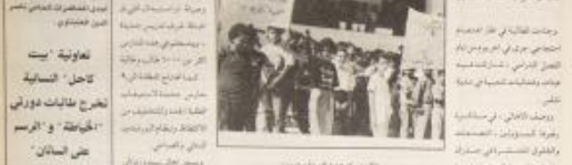
طالبون في بيت وزن يطالبون باقامة بناء جديد، مدرسة بيت وزن

نابلس - د. محمد خير / كانت طلبة المدارس في لواء نابلس يطالبون باقامة بناء جديد، مدرسة بيت وزن، وذلك في ١٦ مدرسة في لواء نابلس.