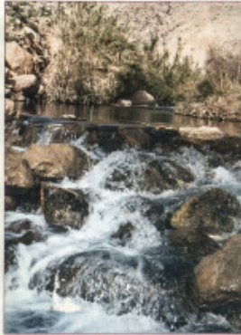
عين النواجا: JERICHO / EIN AL-OJA

وتقع إلى الشمال من مدينة أريحا وهي تعطي نهر الأردن بقاءه وكذلك منطقة شمال أريحا، وتوجد في منطقة عشرات الآبار من الكوارات الحية البرية ومن الطيور المهاجرة وخاصة القورار الأوروبي (الشرقي).