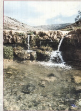
عين قينيا: EIN QENIA - RAMALLA

تعتبر هذه المنطقة من المناطق الميرة للطيور المائية والمهاجرة على حد سواء، وتعيش فيها حتى دمار العام هجرات الأنواع من هذه الطيور الغراب لليل وغراب البحر وحجاجة لاء، والفرد، وبذلك الحزن بأرواحه، والفرد من وادي بن سماء هذه المنطقة طيور اليعسوب أحيانا.