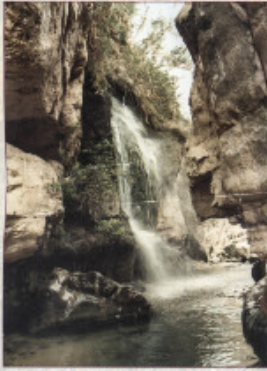
وادي وادي النواجا: JERICHO / WADI AL-QUL

يتخسر من سطح البحر ما يقارب ١٣٩٨، وتعتبر عملية استنزاف موارده الأساسية من أهم المشاكل والصعوبات التي تواجهه.