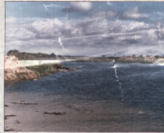
منطقة وادي غزة ومناطق البحر المتوسط: WADI GAZA

تقع إلى الشرق من مدينة القدس وهي بجانب الطريق القروية إلى أريحا من القدس، وتقع بالقرب من منطقة كبريتا بطن عليها اسم وادي صوابيت وتكثر تنوع أنواع الطيور الحرة والمهاجرة التي تمر من فوقها أو تلك التي تنشط فيها، والسبب في ذلك تنوع العيون فيها مثل عيون غارة والقورار والشلط، وتعيش في بعض التجمعات البرية خاصة ما مثل القور العسيري والعزرا، جيلي ونقص الشجر.