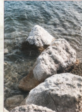
البحر الميت: DEAD SEA

وهو من المناطق الميرة في العالم، تتركب طافرة غريبة من نوعها، لسرعة جريته وتقلباته أحيانا من مستوى سطح البحر، وتعيش بالقرب منه كائنات حية برية متعددة ومتنوعة، والفرد من الأسد الذي كان يعيش في منطقة الشريعة منذ ما يقارب للألف عام.