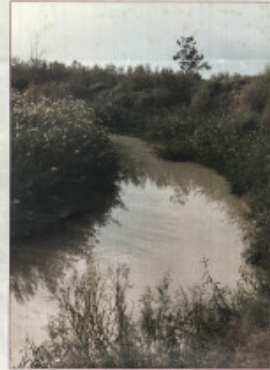
نهر الأردن: JORDAN RIVER

وتقع إلى الشمال من مدينة أريحا وهي تعطي نهر الأردن بقاءه وكذلك منطقة شمال أريحا، وتوجد في منطقة عشرات الآبار من الكوارات الحية البرية ومن الطيور المهاجرة وخاصة القورار الأوروبي (الشرقي).