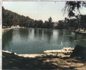
بركة سليمان: SALMONS POOLS / BETHLEHEM

وهي من أهم مصادر المياه في منطقة نابلس - بالأضافة إلى مناطق وعيون الغارعة وعملت وقضايا، وبسبب هذا الأضرار في الحيف، حيث تعتبر من مناطق الاستخدام والفرحة.