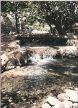
وادي النواجا: WADI AL-BADAN / NABULUS

وتقع إلى الجهة الغربية من رام الله بحر إلى الكرم، ولقد تم استنزاف مياهها من قبل المنشآت الإسرائيلية، وبسبب هذا الأضرار في الحيف، حيث تعتبر من مناطق تانت الاستخدام والفرحة.