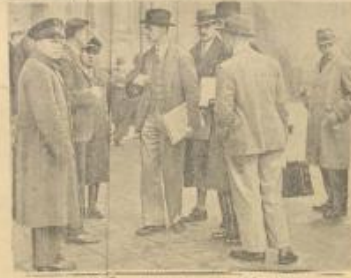
جنس الصابط الاكبر حين وصلهم الى دار برود الاحتفال على النظام في اثناء الاستثناء القديم في البار