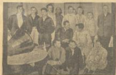
وكاب الباهرة الترحية (ميتو) التي غرقت وهم الذين انتفضهم الباهرة «نيويورك» وأرجتهم إلى بلادهم ويظهر في وسط الصورة الشاب الشيط الغرد فيسين رؤيت الباهرة نيويورك الذي يرجع إليه الفضل في نجات الركاب