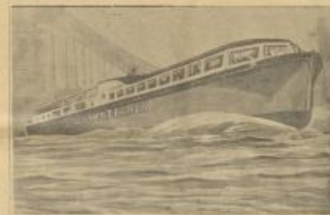
أحد القوارب التي صنعت على هيئة سيارات الباص تحمل القرب من عمل آل آخر في نهر التيس في لندن وبعث القارب ١٢٠ راكباً وقد صنع على ٣٠ لاراً من هذا النوع