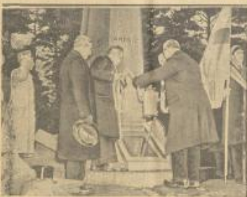
فيلد صنع للطار المشهور أندريه الذي مات في إحدى سفارته الى القلعة الشهيرة في سنة ١٨٩٧ وبعده وقتل آخران