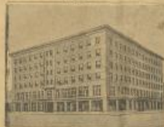
التنقذ الكهربي لستغ عاصمة ولاية ميشيغان في الولايات المتحدة التي استقرت ومات في تشرين ١٣٠ شطناً وأصيب أكثر من مائة شخص بحروق