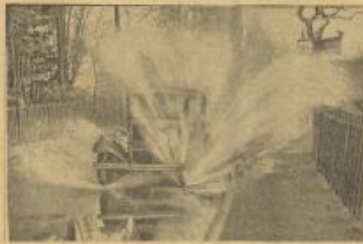
تظهر لمرور برر سقط في كوتيتسري في الكفرا وهذا من الحرائب الأمانة أول مطر سقط في الشتاء، بدلاً من سقوط الثلوج وسبب هذا المزارع كان يتعجب في أير للؤل الذي جعلت مياهه في الصرف للناسي