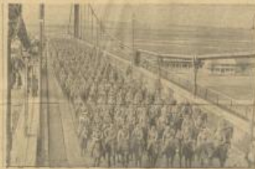
الجسر العظيم في بلشراء الذي يتحدى التيارات المائية واستغرق عمله خمس سنوات وهذا مستدير جسر في البلشراء وبنت تكاليفه ٤٠٠ مليون دينار يوس وفي الصورة يبدو ٨٠٠ سوار يبرون على الجسر لأول مرة لتجربته