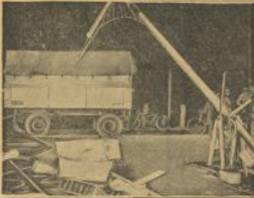
مكبل الكارثة قرب مدينة ليدل. حيث مرّت سيارة باس وقامت ساجز الحضر هذه ماضي خط سكة الحديد في أثناء مرور القطار ذات سبب ذلك ١٣ شطناً وأصيب أربعة بجراح خطيرة