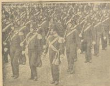
فرقة من الجنود الباليان حين وصلهم الى الشارع لمعاينة على النظام هناك في الاستثناء القديم