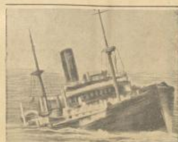
الباحرة الانكليزية «داسيرت» التي غرقت في المحيط الاطلسي وقد جئت لجندتها بحرية حربية خلصت من ركابها ١٨ شخصاً والباقي ماتوا