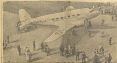
الطائرة الموندية «وينر» التي سبها البرق في سبع الماضي بجوار الرطبة وهي في طريقها من هولندا إلى أندونيسيا وتقل ركابها الثلاثة وسائقها ربة ثم وقفت تحت طقس وقد نزلت جثت ضحاياها إلى بغداد لنقلها فيما بعد إلى هولندا