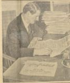
الجنرال جيسل الذي بين قاشا بقوة التولي في البار ولكنه استقال على اثر جاذبة الصابط البريطاني