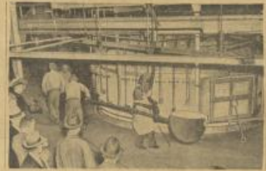
قال في قرية كورنيج قرب نيويورك يملكون في سكة عدة يكون قطرها حصة اثنان لاشتمالها في المرصد العظيم على جبل ولسون