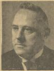
أحمد دوداف بنمري الذي انتخب رئيساً لجمهورية ميسرا لسنة ١٩٣٥