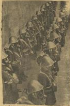
قامت مولاندا في الأسبوع الماضي بأحداث أجشاً لترصد إلى البار للمحافظة على النظام هناك وحسبنا بظهر في الصورة ليس جميع رماية الكمامات ضد التنازلات العامة لاشتمالها هناك حين اللزوم