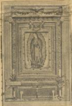
صورة عدة قديمة خزانة لوب الكنسية وقد رسمت سنة ٧٧٢ - وقد تحفة من الذهب وقد سرقتها مجرمون من ألمانيا في إحدى سجون المكسيك