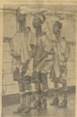
فئات من سكان يورما حضرون مع مركب عظيم إلى لندن ويظهر أن من حادة سكان تلك البلاد تطويل الزهد لأنها تعد جالا ويبلغ طول رتبة اثنان ١٦ ستيندا وعثمان على رفاقهم وأرجلهم من الحرق وأدوات الزينة ما يبلغ وزنها ٣٠ كيلوجراما