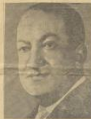
السيد جوز بنجادو سوزانو رئيس جمهورية بوليفيا الجديد وقد قبل شروط عصبة الأمم فوقف الحرب بين بلاده وبين برازيلي التي دامت سبعين ونصف ولسكن برازيلي لم توفها