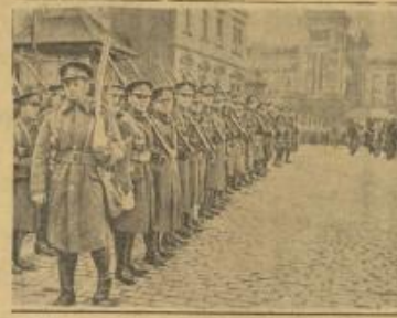
وصول أول فرقة إنجليزية إلى البار للمحافظة على النظام هناك