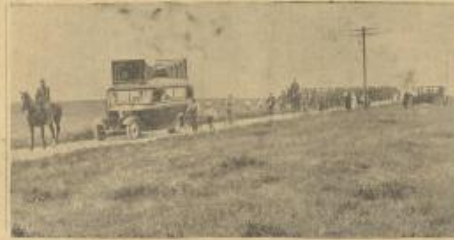
لأول مرة تستخدم آلة كبيرة الموت في جيش الديارك بدلاً من جوق البوقين والسيارة التي تعمل هذا الكثير كبير أمام الجيش تحرف الموسيقى