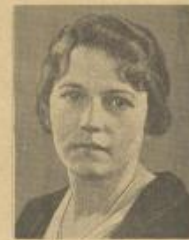
الكتانية الاميركية بول بوك التي امتدت شهرتها الى جميع انحاء المعمور بفضل كتبتها التي تقرأ مستقبلاً