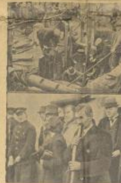
صورة كارثة حدثت في قرية جريستوناس في أونتاريو لاند أعمال إذ أنهار عليه القرب في بحر كان يعلوها قوت تحة بعد سبع ساعة وفي العودة السفلى والده المائل يخاطب ابنه من تحت الردم