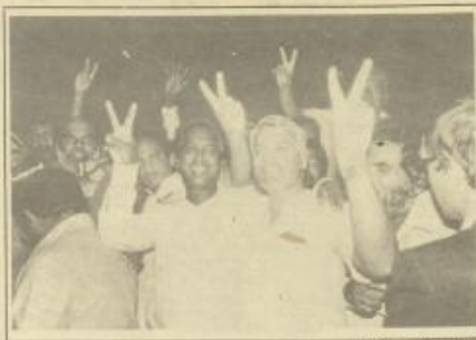
• الطيار من المجموعة الأولى