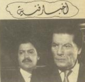
شكري سرحان في أدوار الشر

مجلس شكري، بجران، روما دورة في صالة، روزي في مجلس تافريزي في مجلس عمان الوفاء في ورافات و تشاكاري في قائمة مجلس، دني في دور شروفي في مجلس تافري عده ابراهيم، ميمدا مجلس المن في المجلس صلاح المشار وحسن سرحان و طابية الغني نخلاء العامة