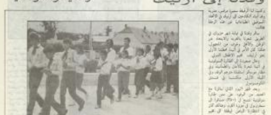
وفود أبناء الكادحين في الاتحاد السوفيتي وتشيكوسلوفاكيا