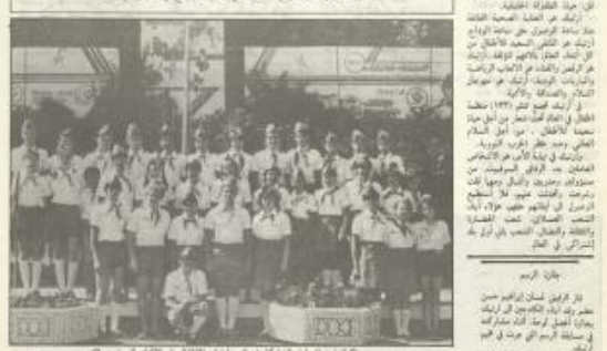
وفود أبناء الكادحين في الاتحاد السوفيتي وتشيكوسلوفاكيا